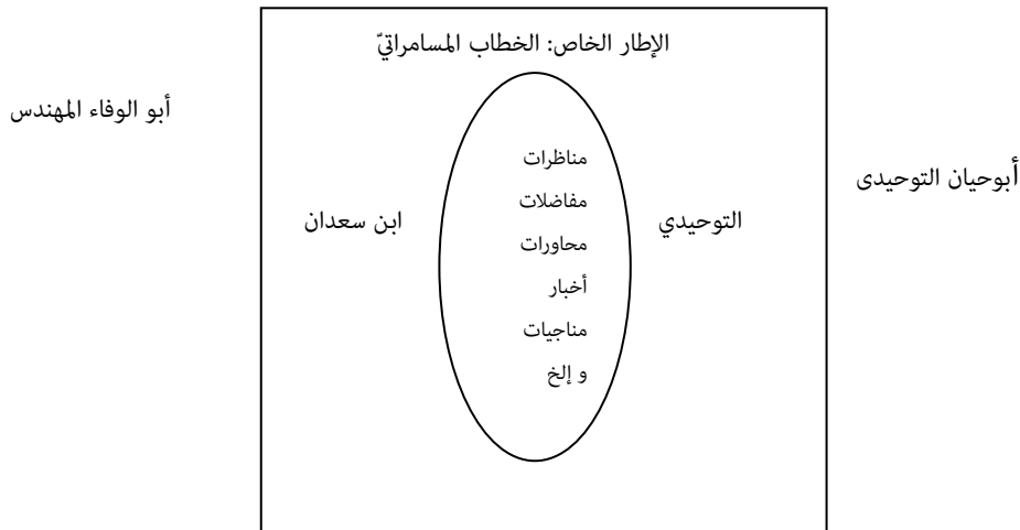
Figure (1) General framework: messenger speech

رقم الشكل (١) الإطار العام: الخطاب الترسلي